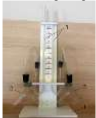
Рис. 4. Прибор для демонстрации зависимости скорости химических реакций от различных факторов: 1 — подставка; 2 — сосуды Ландольта; 3 — манометрические трубки

Прибор состоит из подставки, на которой закреплены две манометрические трубки, которые соединяются с сосудами Ландольта с помощью пластиковой трубки с пробками (рис. 5). Между манометрическими трубками на панели нанесена шкала для наблюдения уровня жидкости в трубках. Окрашенной жидкостью может быть раствор любого красителя в воде.