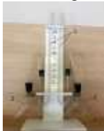
Рис. 4. Прибор для демонстрации зависимости скорости химических реакций от различных факторов: 1 — подставка; 2 — сосуды Ландольта; 3 — манометрические трубки

Прибор состоит из подставки, на которой закреплены две манометрические трубки, которые соединяются с сосудами Ландольта с помощью пластиковой трубки с пробками (рис. 5). Между манометрическими трубками на панели нанесена шкала для наблюдения уровня жидкости в трубках. Окрашенной жидкостью может быть раствор любого красителя в воде.